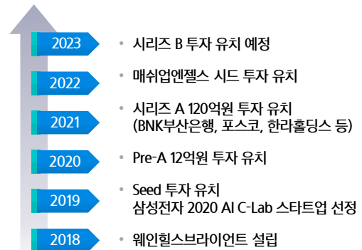
그림 3. 웨인힐스브라이언트시 주요 연혁